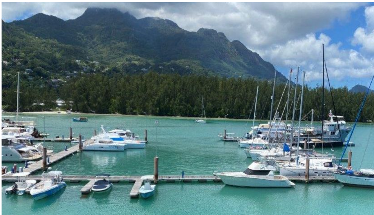
Poloha apartmánu v resortu Eden Island

(Cena nezahrnuje nábytek a notářské poplatky.)