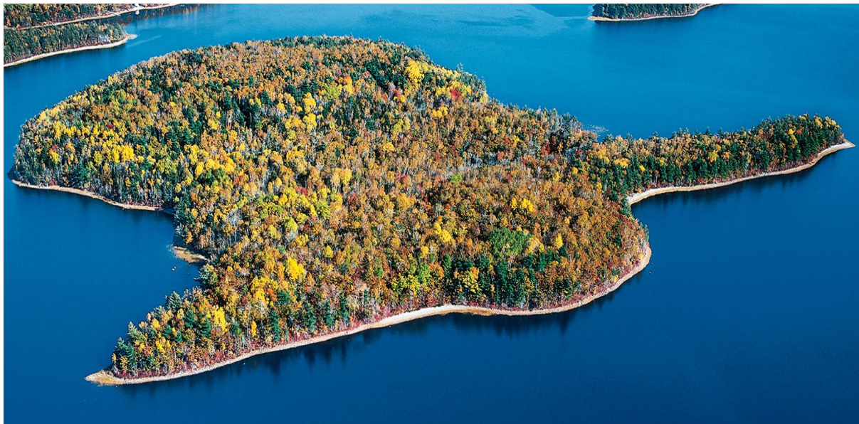
Ostrov Big La Mouna na jezeře Ponhook

(Prodej do osobního vlastnictví vždy v bloku po čtyřech pozemcích)