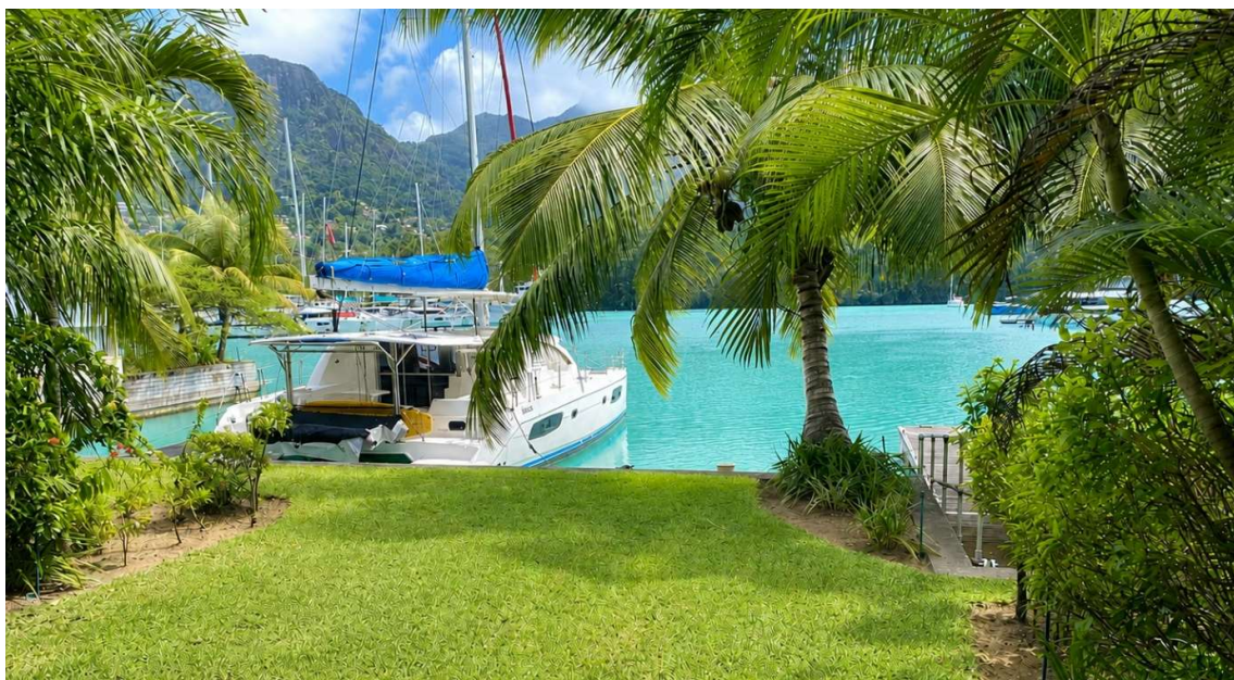
Poloha apartmánu a kotviště pro loď

(5% Stamp duty, 1,5% Sanction Application Processing Fee, 1,5 % Notary Fee)