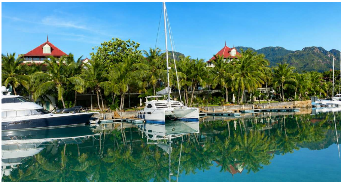
Poloha apartmánu a kotviště pro loď

Cena: 480 000 USD (včetně nábytku) + daně z převodu (5% Stamp duty, 1,5% Sanction Application Processing Fee, 1,5 % Notary Fee)