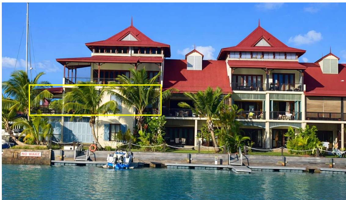
Poloha apartmánu a kotviště pro loď

Cena: 795 000 USD (včetně nábytku) + daně z převodu (5% Stamp duty, 1,5% Sanction Application Processing Fee, 1,5 % Notary Fee)