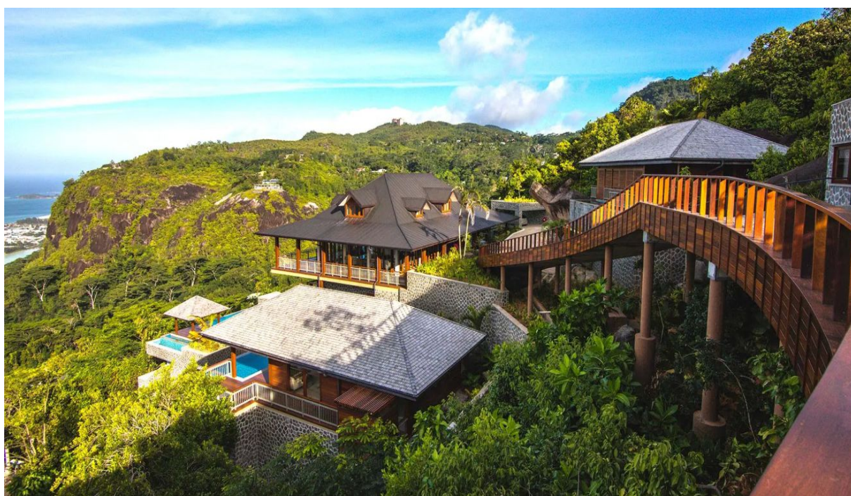
Вилла расположена на курорте Royal Palm Residences

Общая площадь участка: 6 364 м 2 , жилая площадь: 2 800 м 2 , длина бассейна: 50 м На участке расположены: главная вилла с 3 спальнями, 3 отдельных апартамента с 1 спальней, бассейны