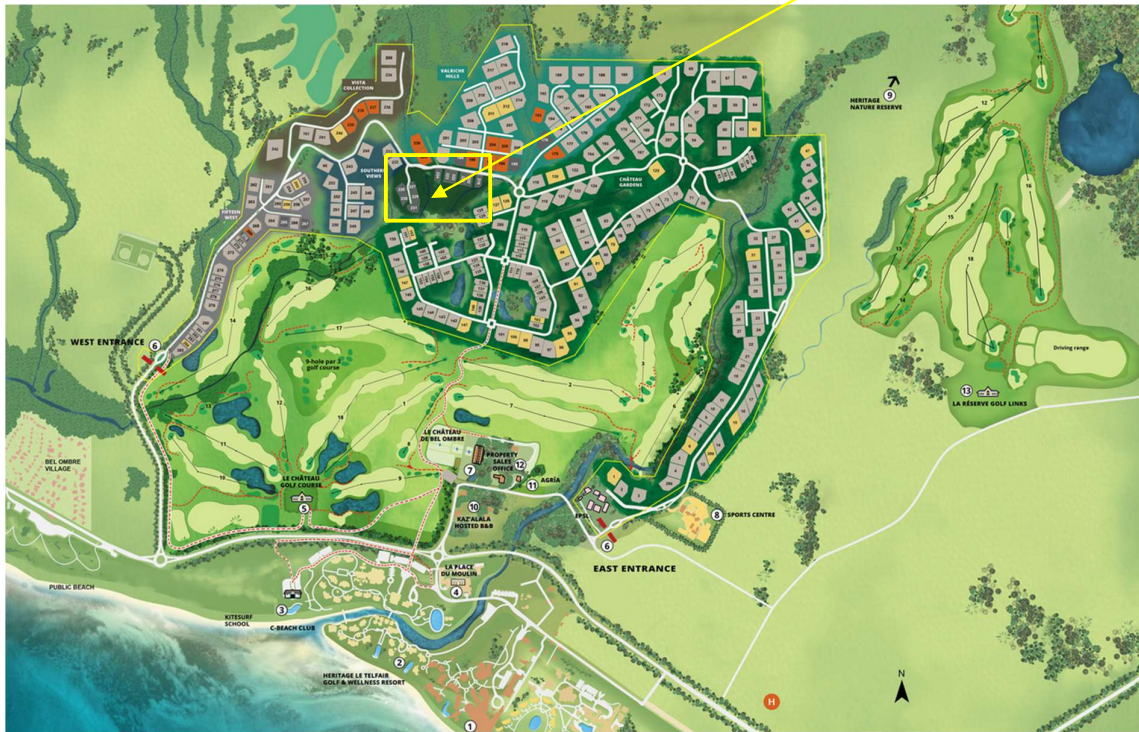
Vily typu A